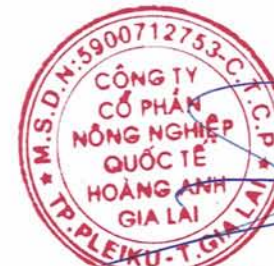
Nguyễn Xuân Thắng