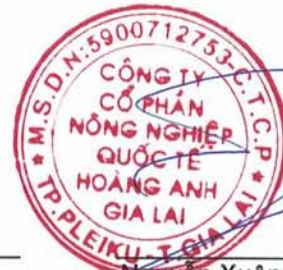
Nguyễn Xuân Thắng